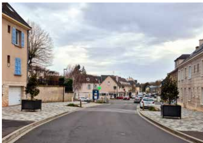
De nouvelles jardinières en aluminium ont été posées avenue de la Paix, les plantations en pleine terre y étant impossibles à cause de la présence de nombreux réseaux. Des magnolias, adaptés à ce type d'aménagement, y ont été implantés.

D'ici le printemps les aménagements seront complétés par la pose de mobilier urbain supplémentaire (notamment des supports vélos), quelques traçages et le marquage définitif des derniers passages piétons. Une inauguration ouverte à tous sera organisée. Nous aurons l'occasion d'en reparler.