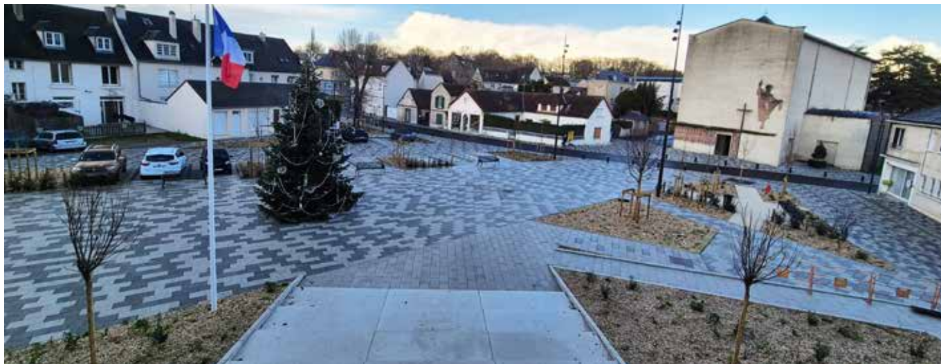
Les travaux place de l'Eglise ont pris fin en décembre. Restant à terminer quelques menus aménagements dont la pose de supports pour vélos.

Après 20 mois de travaux, débutés en avril 2023, les ouvriers ont quitté le chantier des aménagements publics du Cœur de village, qui se sont terminés par la pose du mobilier urbain et la plantation d'arbres et espaces verts place de l'Eglise. C'est l'aboutissement d'un travail collectif qui a rassemblé les élus et agents de la ville de Lèves, la SPL Chartres aménagement en qualité de maître d'ouvrage, le groupement de maîtrise d'œuvre et les entreprises de travaux.