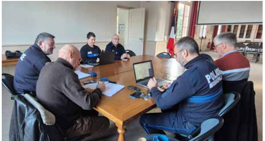
Réunion trimestrielle rassemblant les représentants de la police nationale et de la police municipale de Lèves (en présence ici de la police municipale de Champhol, le 14 novembre 2024).

La présence de la police municipale sur le terrain aide à éviter des actes de délinquance. C'est le cas notamment avec l'opération tranquillité vacances, qui permet toute l'année une surveillance accrue des habitations des Lévois, à leur demande, lors d'absences prolongées. Pour en bénéficier, il suffit de renseigner le