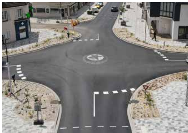
Une étoile a été dessinée au cœur du giratoire du centre-ville, symbolisant le carrefour des cinq routes, et rappelant l'étoile présente sur le blason de la ville de Lèves. Restent à dessiner les derniers passages piétons au printemps lorsque le climat le permettra.