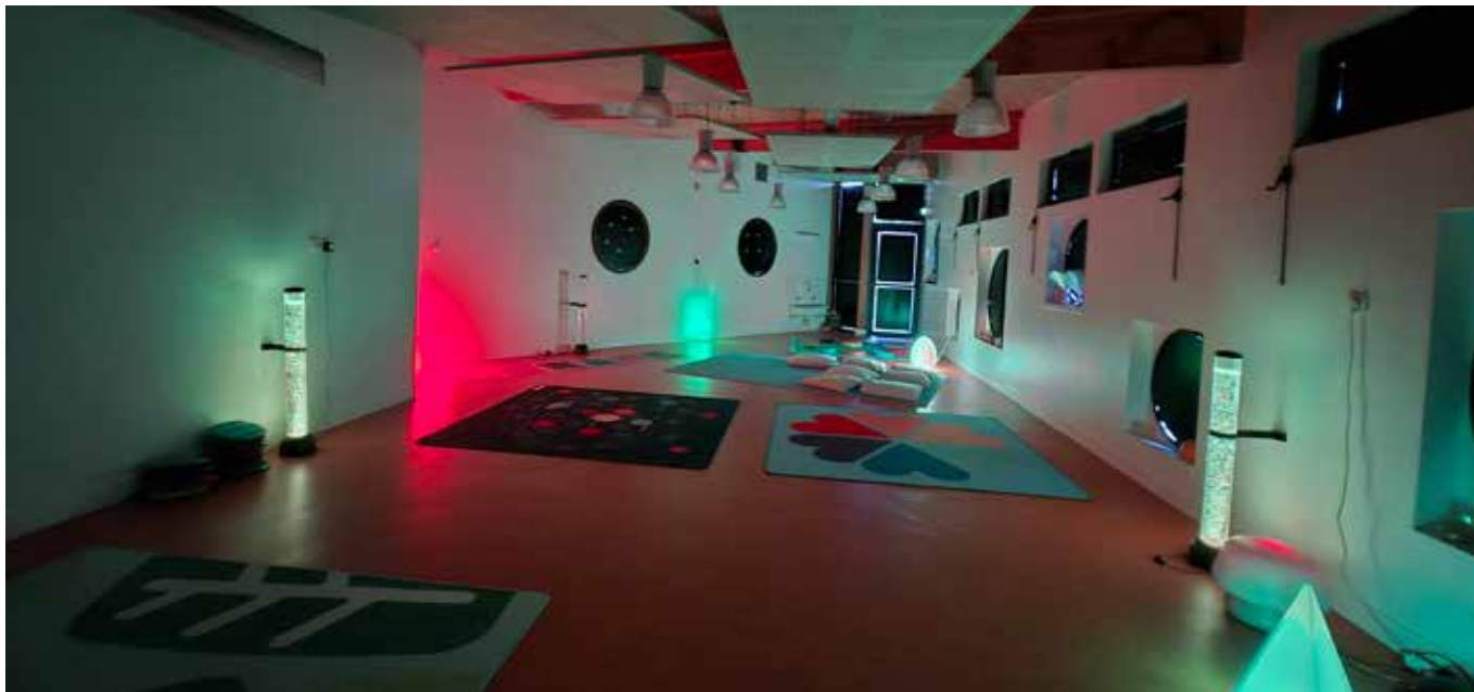
La salle snoezelen au sein du pôle enfance Jean-Pierre Reschoeur.

Récemment, la municipalité a mis en place une salle snoezelen au sein du pôle enfance Jean-Pierre Reschoeur. D'abord utilisée par les enfants de l'accueil de loisirs maternel, elle sera également accessible à la rentrée de janvier aux enfants des crèches municipales et aux élèves de l'école maternelle.