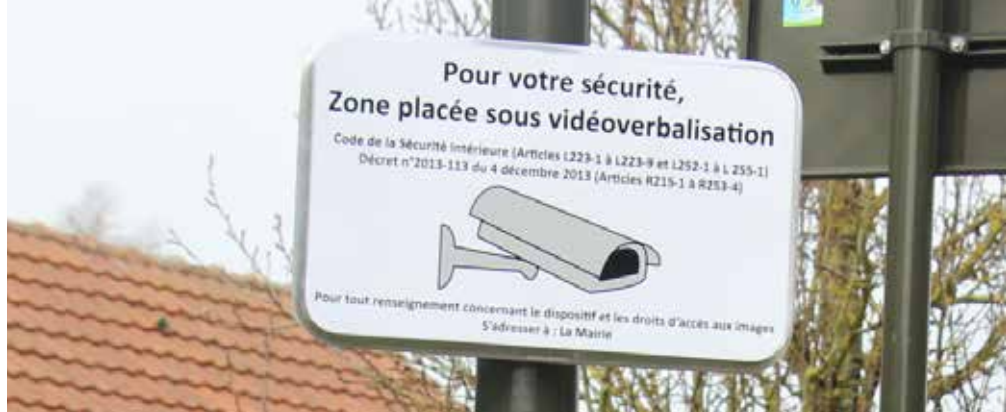
La rue de Longsault est la seule rue du département d'Eure-et-Loir à bénéficier d'un dispositif de vidéo-verbalisation pour lutter contre le trafic de transit de poids-lourds. En 3 ans et demi, 1200 contraventions ont été effectuées.

Dans un but à la fois pédagogique mais aussi répressif, la police municipale effectue régulièrement des contrôles de vitesse, mais avec l'impossibilité de couvrir intégralement et en permanence nos 30km de voirie communale. Aussi, en cas de constat de délinquance routière, par exemple le même véhicule qui passe chaque jour à vitesse excessive dans telle rue à telle heure, il est essentiel que les habitants nous tiennent informés, afin que l'on ajuste les interventions de la police. La sécurité est l'affaire de tous.