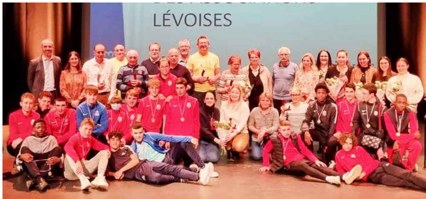
Lors de la dernière soirée des associations le 30 mars 2023, bénévoles et sportifs récompensés sur la scène de l'espace Soutine.