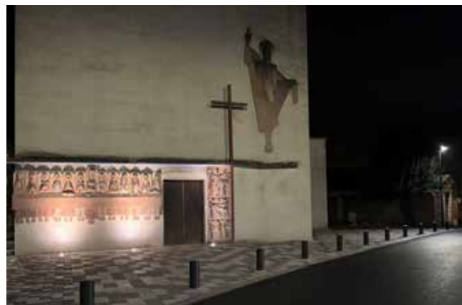
Depuis la mi-décembre, les bas-reliefs de Jean-Lambert Rucki sont mis en lumière.

Pour pouvoir procéder à l'ensemble des travaux, dont l'évaluation totale s'élève à près d'un million d'euros TTC, la ville a récemment déposé un permis de construire qui est en cours d'instruction au moment de la rédaction de ce magazine. Nous aurons l'occasion de revenir prochainement sur ce sujet.