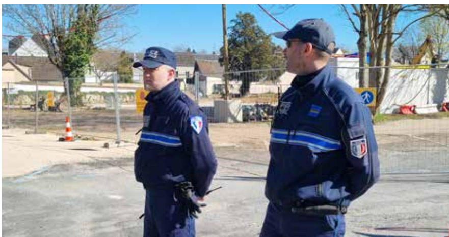
Les deux policiers municipaux sur le terrain. Ici à 16h30 lors de la sortie des élèves de l'école Jules Vallain durant les travaux du Cœur de village.

En 2024 la ville de Lèves a complété son dispositif, composé actuellement de 38 caméras, ce qui fait l'une des meilleures couvertures du département par rapport au nombre