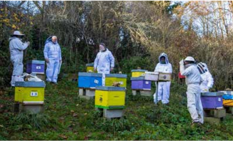
Une de nos dernières interventions le 30 novembre dernier.

Chers membres et amis de l'Abeille Lévoise, L'année 2024 s'achève sur une récolte normale, satisfaisante pour nos apiculteurs. Le moment fort de cette année a été sans doute notre Fête de l'Abeille, le 15 septembre, qui a réuni de nombreux participants et a contribué à mettre en lumière notre passion commune pour la préservation de l'abeille. Merci à tous pour votre implication et votre soutien. Nous vous souhaitons de joyeuses fêtes et avons hâte de vous retrouver en 2025 pour de nouveaux projets ! Bien cordialement, L'équipe de l'Abeille Lévoise