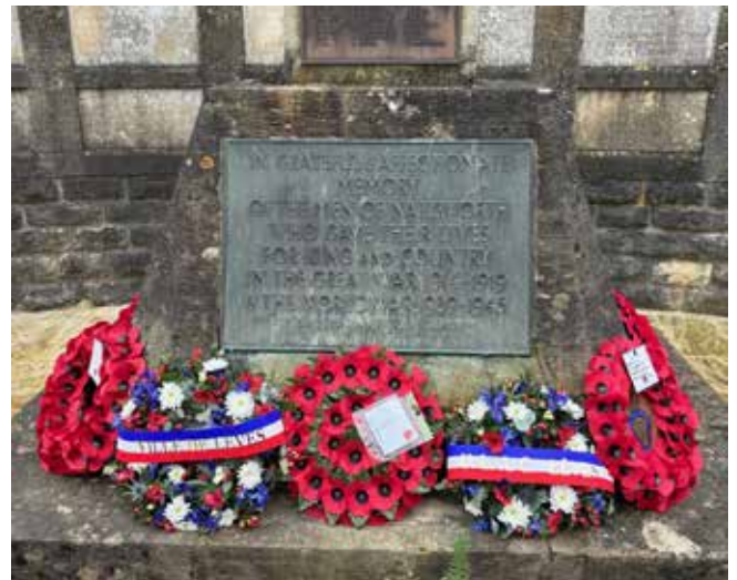
Les gerbes de fleurs de la ville de Lèves et du comité de Jumelage parmi les couronnes de Poppies au pied du Monument aux morts de Nailsworth.

Les échanges entre habitants de Lèves et de Nailsworth durant ce week-end mémoriel eurent notamment pour objet de commencer à préparer les 30 ans du Jumelage, qui aura lieu à Lèves du 2 au 5 mai prochains. Rendez-vous est pris.