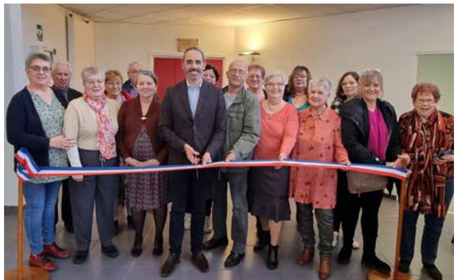
Parmi tous les projets en faveur du monde associatif : inauguration en 2023 de la rénovation et de l'agrandissement de la salle 3 de l'espace Soutine, avec les membres de l'association Charles Gautier.