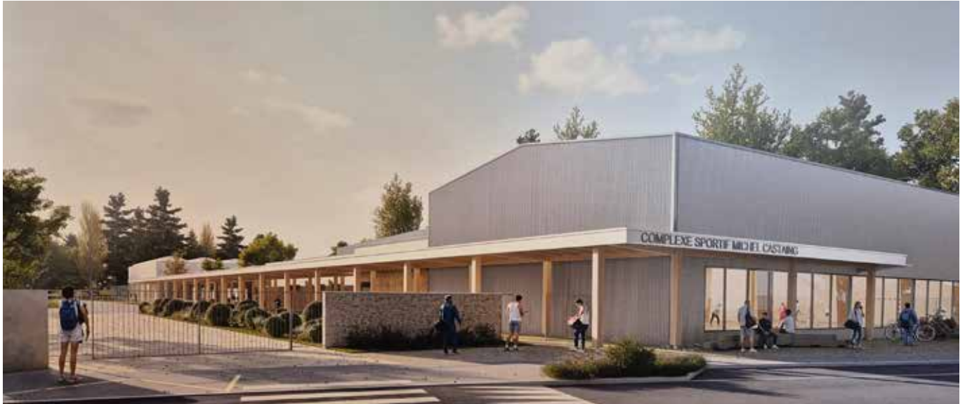
Esquisse du cabinet AP Architectures, lauréat du jury de concours, présentant une nouvelle entrée rue de Josaphat, ainsi qu'une mise en cohérence de l'ensemble du complexe sportif.

Lancée en début de mandat (ndlr : 2020 – 2026), l'idée d'une rénovation des bâtiments du complexe sportif a fait son chemin.