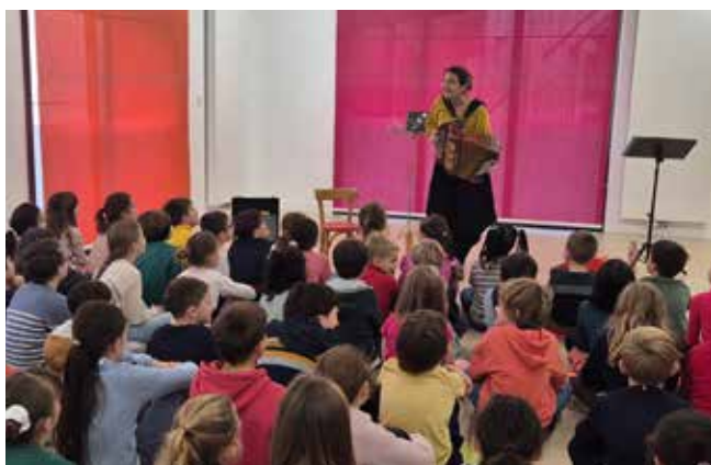
Une animation "livres et voix" était proposée aux enfants pour l'occasion.

N'attendez plus et venez à la rencontre des bénévoles pour vous inscrire !