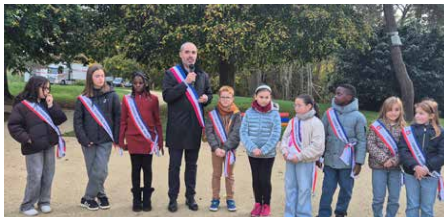
Avec les conseillers municipaux jeunes lors de l'inauguration du banc des CMJ au square Griffith.

Les Lévois ont la chance de bénéficier de services à la population qui fonctionnent globalement bien, avec des agents municipaux qui ont gagné en compétence et qui font preuve d'un véritable sens du service public. Nous cherchons sans cesse à améliorer la situation, tout en tenant