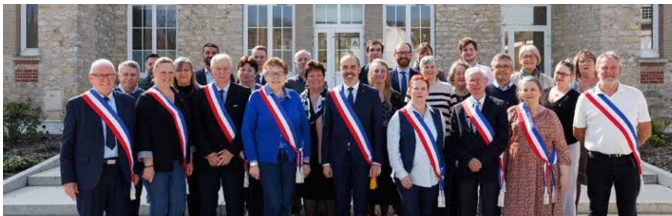
La belle journée printannière a également permis de prendre une photo de groupe à l'extérieur, sur le nouveau parvis de l'Hôtel de ville.