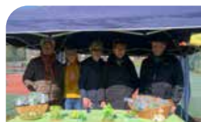
P19 Vie des associations