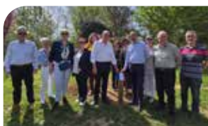
P13 Lèves engagée pour les arbres