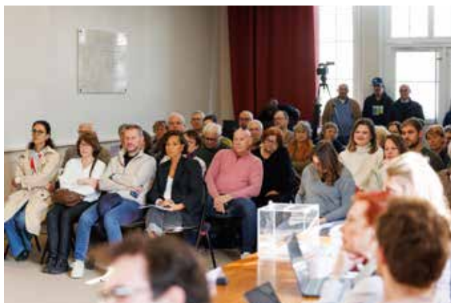
La salle du Conseil a accueilli un nombreux public.