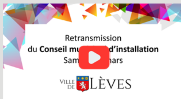
Retrouvez la vidéo du Conseil d'installation sur le youtube de la ville.