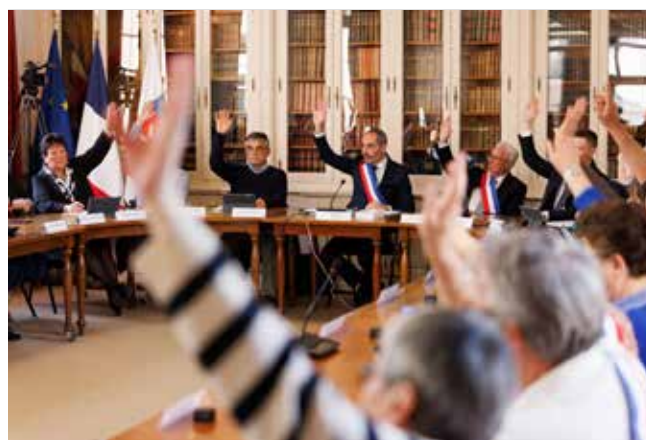
Plusieurs délibérations ont été adoptées, parmi lesquelles l'élection des adjoints au maire.