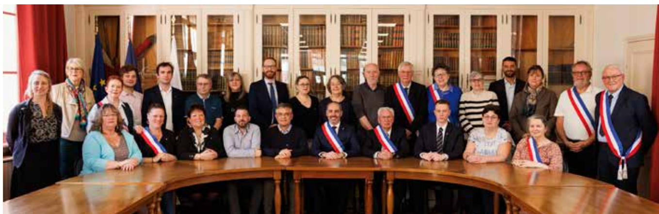
Tradition respectée, avec la photo de l'ensemble des élus du Conseil municipal à l'issue de la séance d'installation, dans la salle du Conseil de l'Hôtel de ville.