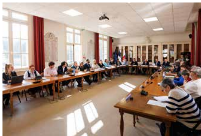
Installation des élus du Conseil municipal de Lèves lors de la séance du 21 mars 2026 à l'Hôtel de ville.

La nouvelle équipe municipale a pris ses fonctions officiellement le 21 mars dernier, date du Conseil municipal d'installation. Le Conseil municipal est composé de 29 élus dont 8 adjoints au maire, 1 conseiller municipal délégué, 15 conseillers municipaux de la majorité et 4 conseillers municipaux de l'opposition.