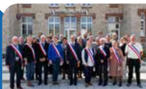
P8 L'installation du Conseil municipal en images