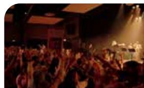
P14 La musique a résonné à Lèves avec la 2 ème édition de la Semaine Musicale