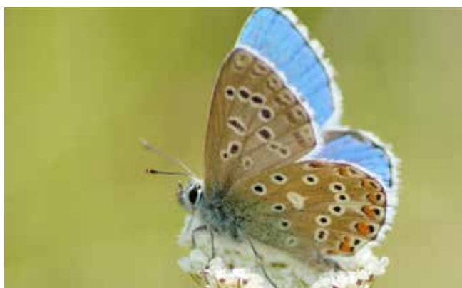
Espèce de papillon patrimoniale appelé Azuré bleu-céleste visible à Lèves.

Vous êtes conviés à la restitution de l'événement le lundi 25 mai à 14h place de l'Eglise.