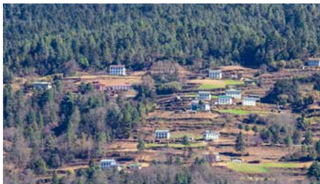
L'association souhaite construire des réserves d'eau pour distribuer l'eau dans chaque maison du village de Bagam.