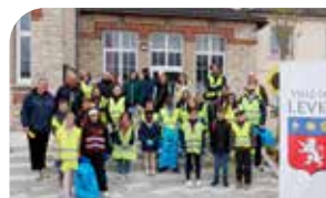
P16 Retour en images