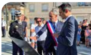
P3 Interview de début de mandat du maire