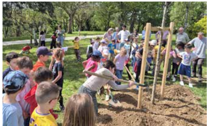
Plantation d'un arbre avec la participation des enfants de l'école Jules Vallain à l'Arboretum.

En complément de la signature officielle, un cormier ( Sorbus Domestica ) a été planté à l'Arboretum du square Griffith. Des élèves de l'école élémentaire ont participé à la mise en terre de cet arbre rare qui symbolise la longévité, la sagesse et la protection.