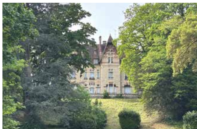
Au cœur du terrain occupé par l'ADSEA se dresse le Château des Boissières.