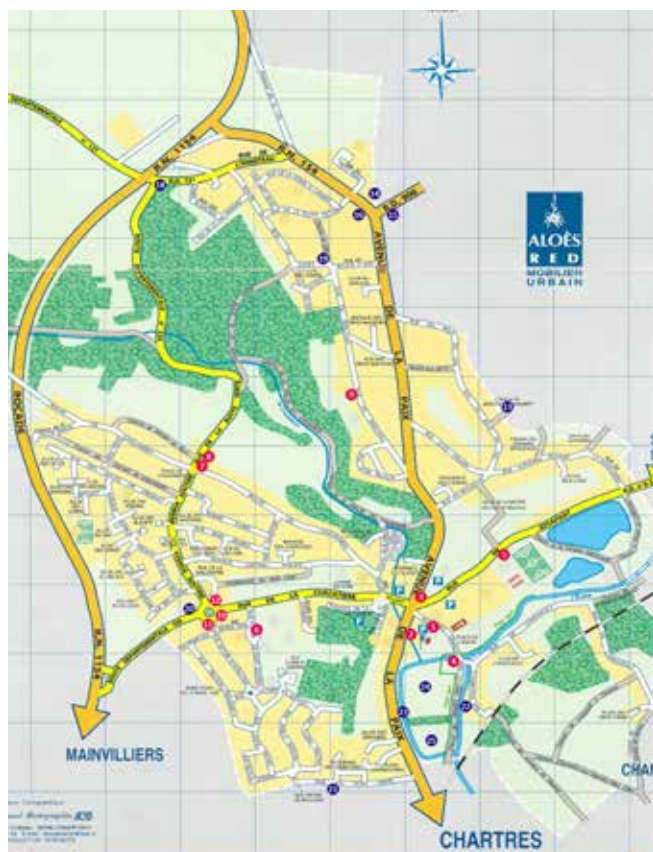
Implantation actuelles et à venir des caméras de vidéoprotection.

La vidéoprotection de la ville de Lèves est opérationnelle sur l'ensemble de la commune. Son développement se poursuit. L'implantation des nouvelles caméras s'est faite après expertise du référent sûreté de la police nationale. Ce spécialiste dans le domaine de la prévention a guidé notre choix sur les sites à protéger, sur les flux de circulation et la surveillance des entrées de la ville. Notre dispositif de vidéoprotection sera constitué de 25 caméras à la fin de 2020. Cet équipement vient en complément de la présence humaine, notre police municipale et la police nationale.