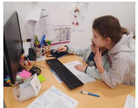
Les conseillers municipaux jeunes rédigent les textes de cette gazette.